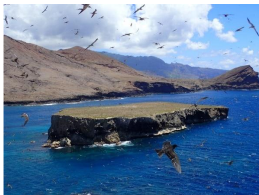
Ilot Teuaua à Ua Huka (Marquises)

Pour plus d'information sur ce projet, rendez-vous sur le site de la SOP MANU .