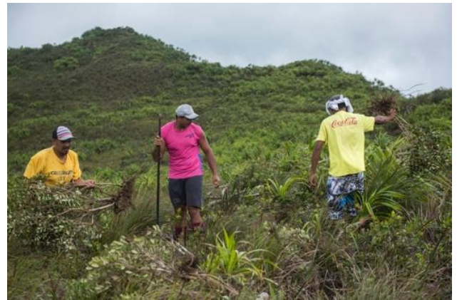
Arrachage des plantes envahissantes

Sept plantes envahissantes étaient présentes sur la zone contrôlée (voir carte n°2). Au total 5 153 pieds-mères de Feijoa (en violet sur la carte) et 2 162 pieds-mères de goyavier de Chine (en rouge sur la carte) ont été arrachés.