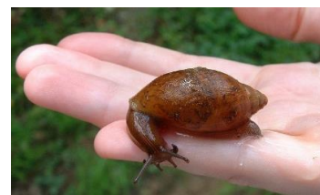
Escargot carnivore (Euglandine) : De couleur marron clair à rose, il est de taille moyenne (jusque 7cm)

L'escargot carnivore Euglandine, inefficace contre l'escargot géant, est classé « menace pour la biodiversité » ce qui fait qu'il est interdit de le transporter entre les îles. De plus, les œufs d'escargots pouvant se trouver dans la terre, il est également recommandé de ne pas transporter de plantes en pot entre les îles.