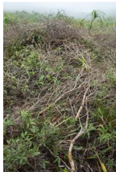
Tas de bois mort

Deux panneaux d'information ont été disposés au bord des deux sentiers de randonnées permettant d'accéder à ces bassins versants.