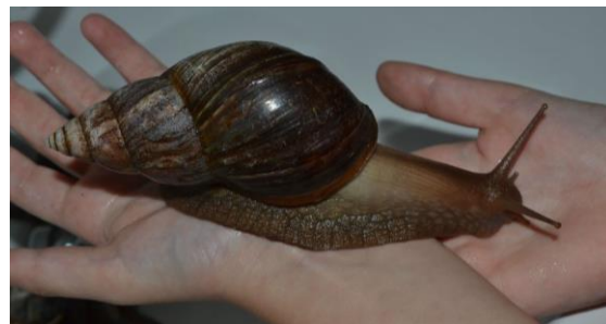
Escargot géant d'Afrique (Achatine) : De couleur marron, il est reconnaissable par sa grande taille (jusque 15cm de long).

Dans les années 70, l'escargot carnivore Euglandine a été introduit et relâché pour s'attaquer à l'escargot géant, à Tahiti en 1974 puis à Moorea en 1977. Malheureusement cet escargot s'est attaqué à des proies plus faciles : les petits escargots de Polynésie française, les partulas. L'escargot carnivore est maintenant présent sur 11 îles de Polynésie française, il est responsable de l'extinction de près de 60 espèces d'escargots polynésiens, uniques au monde.