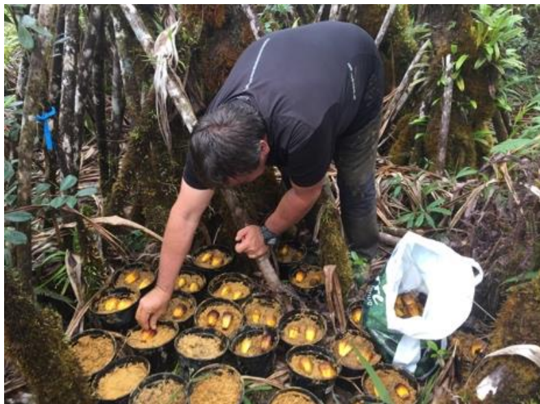
Pépinière de Pandanus temehaniensis

Les déchets verts s'avèrent être un problème majeur en raison de leur très lente dégradation (plus de 10 ans) et de leur surface (74% de la surface dégradée).