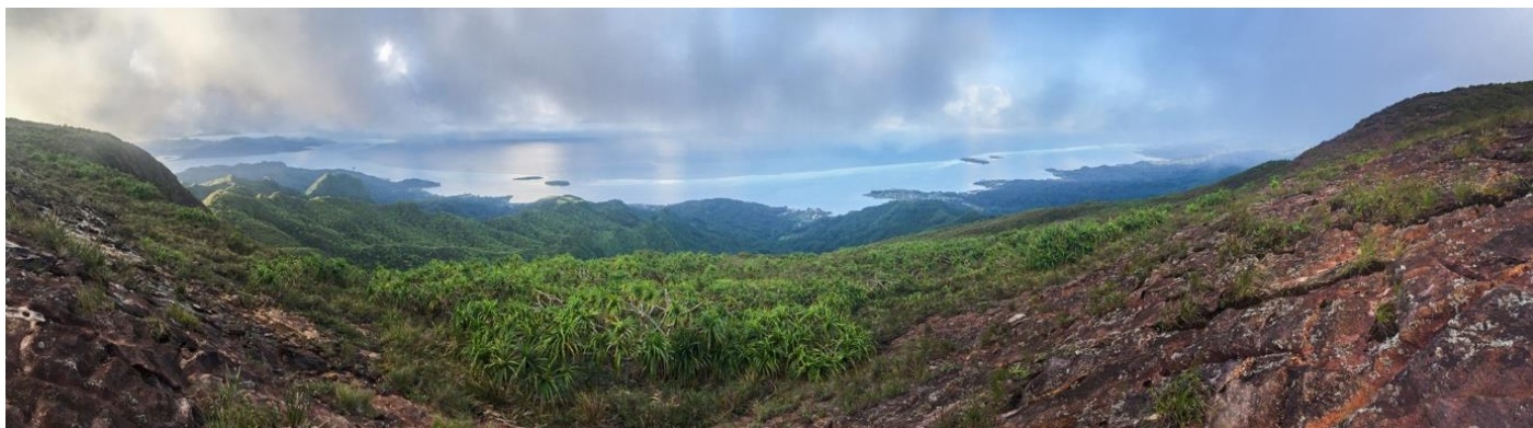
Un des petits bassins-versants en cours de restauration sur le plateau Te Mehani rahi (Raïatea)