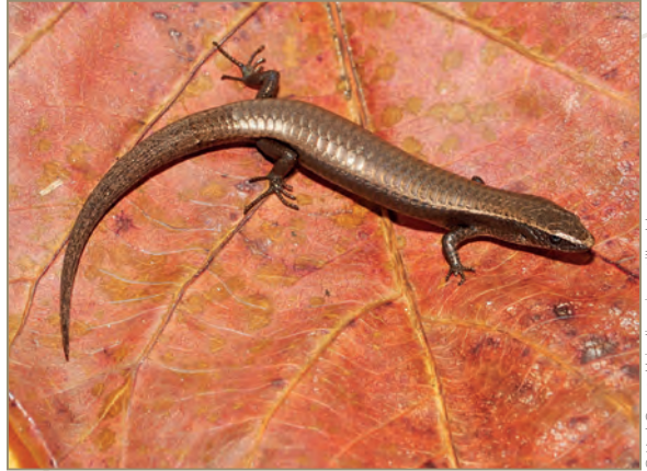
Gymnophthalmus underwoodi – Gymnophthalme d'Underwood