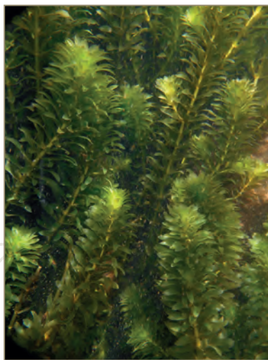
Hydrocharitaceae ; Hydrilla verticillata – Hydrille verticillée