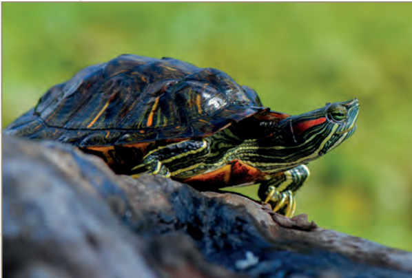
Emydidae; Trachemys scripta elegans – Tortue de Floride