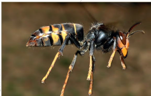
Vespa velutina nigrithorax – Frelon asiatique