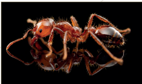
Solenopsis invicta – Fourmi de feu