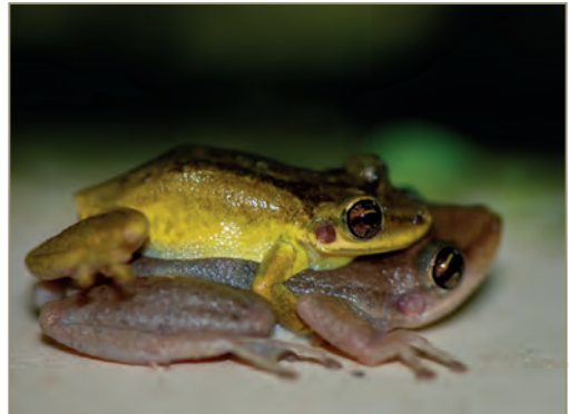
Eleutherodactylus johnstonei – Hylode de Johnstone