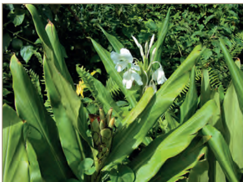
Hedychium coronarium – Hédychie couronnée