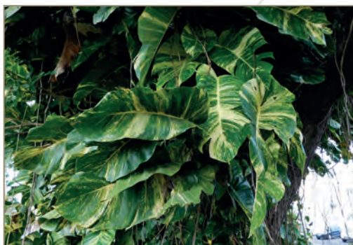
Flemingia spp; Flemingia strobilifera – Sainfoin du Bengale