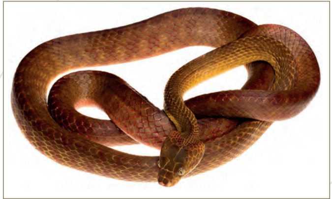
Pythonidae; Boiga irregularis