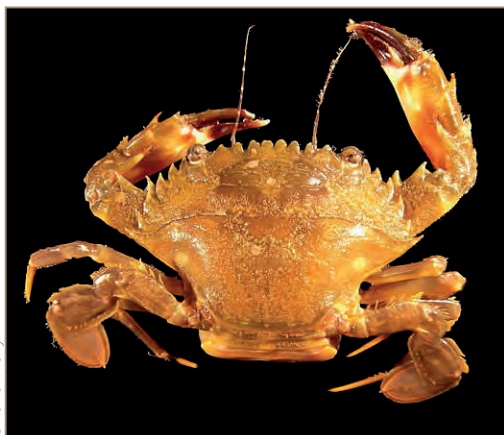
Charybdis hellerii – Crabe nageur à pinces épineuses