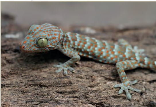
Gekko gekko – Gekko tokay