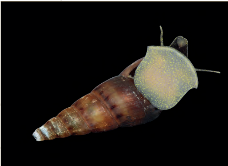
Lissachatina fulica – Achatine