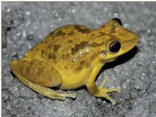
Hylidae; Scinax ruber – Rainette des maisons (mâle et femelle)